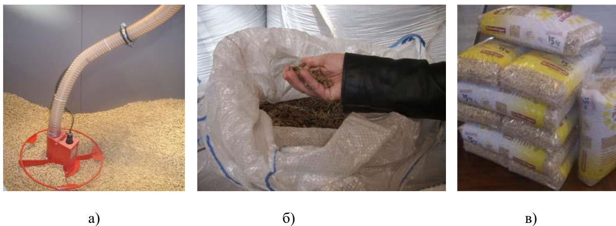
Рисунок 5 – Розфасовка пелет насипом а), у біг-беги б) та дрібно в)

Останнім етапом виготовлення брикетів є фасування готових виробів, яке проводиться у вільному вигляді – насипом, розфасовкою в біг-беги та дрібною розфасовкою (рис. 5).