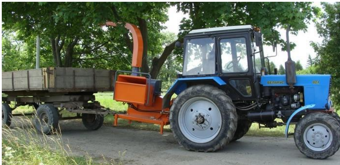
Рисунок 1 – Зовнішній вигляд подрібнювача RM 800.5 приєднаного до трактора

кріплення до будь-якого трактора, де є вал відбору потужності та гідравлічна станція, що дозволяє без використання додаткового обладнання експлуатувати їх в межах міста, паркових та придорожніх зонах (рис. 1) [4].