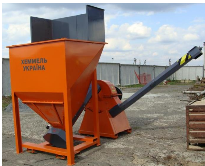
Рисунок 2 – Зовнішній вигляд молоткового подрібнювача RM 800.7

Третім етапом є остаточне подрібнення щепи до розмірів фракції 2...5 мм. Зазначена величина подрібненої щепи як і її вологість в межах 6...8 % забезпечує якісне брикетування. Невідповідність цим вимогам ускладнить процес брикетування та знизить якість горіння, а також зовнішній вигляд брикетів, що вплине на їх реалізацію. Це пов'язано з тим, що при вологості щепи більше 10...15 % під час пресування брикетів вони будуть «розірвані» внутрішнім тиском, створеним рідиною, яка виникає при стисненні подрібненої маси. Остаточне вторинне подрібнення щепи можна проводити за допомогою молоткових подрібнювачів типу RM 800.7 (рис. 2). Їхніми перевагами є простота експлуатації та конструкції.