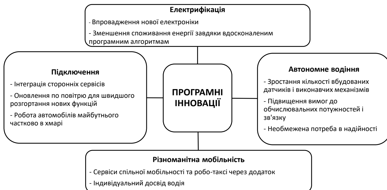
Рис. 1. Приклади програмних інновацій

Автомобілі завтрашнього дня перейдуть на платформу нових відмінностей. Ймовірно, вони включатимуть інновації в інформаційно-розважальній сфері, можливості автономного водіння та інтелектуальні функції безпеки, засновані на поведінці «відмов у роботі» (наприклад, система, здатна виконувати свою ключову функцію, навіть якщо частина її виходить з ладу). Програмне забезпечення переміститься далі в цифровий стек для інтеграції з апаратним забезпеченням у формі розумних датчиків. Стеки стануть горизонтально інтегрованими та отримують нові рівні, які перетворюють архітектуру на COA.