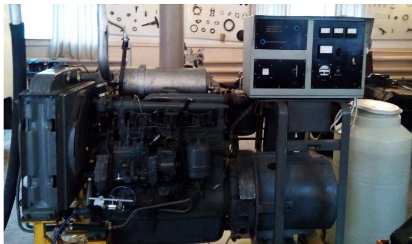
Рисунок 1 – Установка для проведення експериментальних досліджень

Для перевірки адекватності математичної моделі «Двигун – система живлення сумішшю дизельного та біодизельного палив» було проведено експериментальне дослідження розгону і сповільнення колінчастого вала дизеля при роботі на дизельному та біодизельному паливах. Порівнюючи дані, отримані експериментальним та розрахунковим шляхами, перевірялась адекватність математичної моделі. Експериментальне дослідження проводилось на дизелі СМД–15Э (рис. 1) [9].